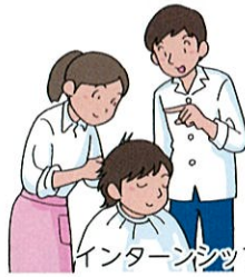
インターンシップの実施

組合を窓口とした日本政策金融公庫の低金利・長期返済の融資により経営の安定を支援しています。